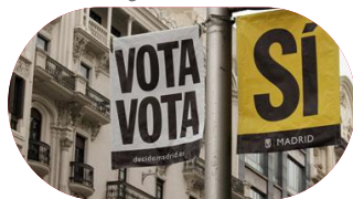
Campagne réalisée par la première votation en 2017 (Image : Votz, Votz. OUI)

Votation convoquée par la Mairie sur la réorganisation de la «Plaza de España» dans laquelle un 10% de l'électorat a participé.